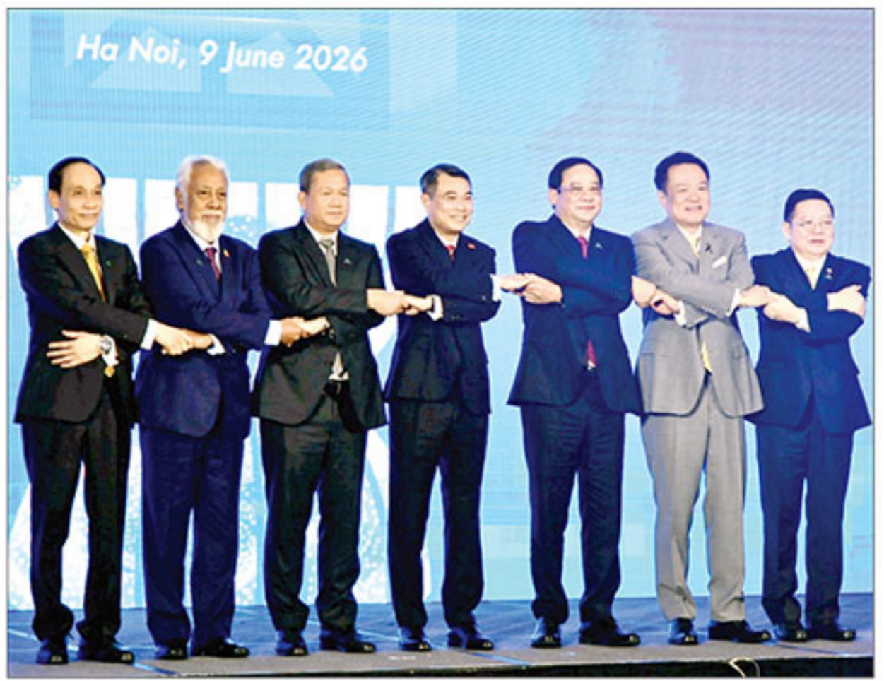
▲ เปิดประชุม : นายอนุทิน ชาญวีรกูล นายกรัฐมนตรีและรวมพลไทย เข้าร่วมพิธีเปิดประชุม ASEAN Future Forum ครั้งที่ 3 ภายใต้หัวข้อ "Shaping our Future Together: Peace, Prosperity, People-Centered" ซึ่งมีเวียดนามเป็นเจ้าภาพ โดยถ่ายทอดสดกับผู้ชมประเทศไทยที่โรงแรม Melia Hanoi กรุงเทพมหานคร สาธารณรัฐสังคมนิยมเวียดนาม

รัฐบาลชวนใช้สิทธิไทยช่วยไทยฯ ผ่าน 4 แพลตฟอร์มเดลิเวอรี่ เริ่ม 15 มิถุนายนนี้ ลดค่าอาหาร 80% ผ่านแอปฯ เป้าตั้ง ปลัดคลัง ➔ ต่อ : บัตรคนงาน -หน้า 8