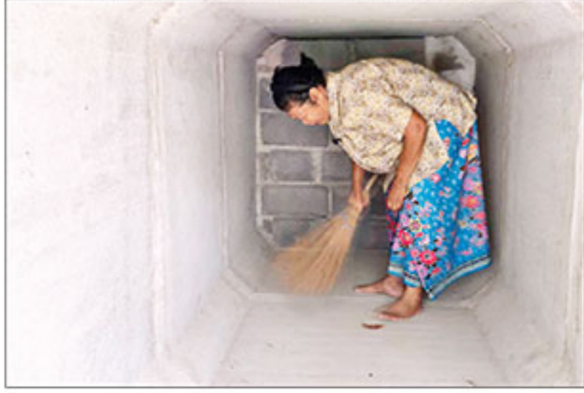
▲ พร้อมอพทพ : ชาวบ้านในพื้นที่ หมู่ 9 ตำบลจันทนเพชร อำเภอบ้านกรวด จังหวัดบุรีรัมย์ กำลังทำความสะอาดบึงเกอร์ หลังคิดล้นฆ่าชาวสวนการณธ์ชายแดน ไทย-กัมพูชา อย่างโหดเหี้ยม พร้อมจัดเตรียมเสื้อผ้า ยารักษาโรค รวมถึงสิ่งของจำเป็น ใส่ลงในเรือบรรทุก เพื่ออพยพได้ทันทีหากปะทะกันรอบ 3