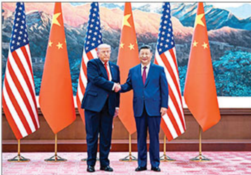
▲ ชำพันพันธ์ : ประธานาธิบดีโดนัลด์ ทรัมป์ ของสหรัฐอเมริกา จับมือกระชับสัมพันธ์กับ ประธานาธิบดี สี จิ้นผิง ของจีน ระหว่างการเยือนสาธารณรัฐประชาชนจีนอย่างเป็นทางการ ที่มหาศาลาประชาชน กรุงปักกิ่ง โดยจีนได้จัดพิธีต้อนรับผู้นำสหรัฐฯ อย่างสมเกียรติ