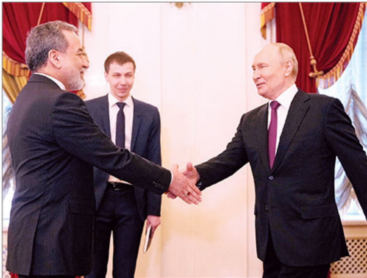
▲ หนุนอิหร่าน : นายวาเลอิมิร์ ปูติน ประธานาธิบดีรัสเซีย คือนับ นายอับบาส อารักชี รัฐมนตรีต่างประเทศอิหร่าน ที่เจนีวาเมื่อวันพุธที่ผ่านมา ซึ่งเข้าร่วมหารือสถานการณ์ความตึงเครียดในตะวันออกกลาง โดยผู้นำรัสเซีย แสดงท่าทีชัดเจนในการสนับสนุนการปกป้องอธิปไตยของประชาชนอิหร่าน

มือยิงงานเลี้ยงสื่อทำเนียบขาว เจอข้อหาหนัก “พยายามลอบสังหารปรน.สหรัฐฯ” เสี่ยงถูก ตลอดชีวิต ด้านแผนลดสันติภาพไม่ถืบ โดย สหรัฐฯยังไม่รับเงื่อนไขให้อิหร่านคุมช่องแคบ ฮอร์มุซและยืนยันเตหะรานต้องไม่มีนิวเคลียร์ อีกต่อไป ส่วนทรัมป์ ➡ ต่อ : ทรัมป์ -หน้า 10