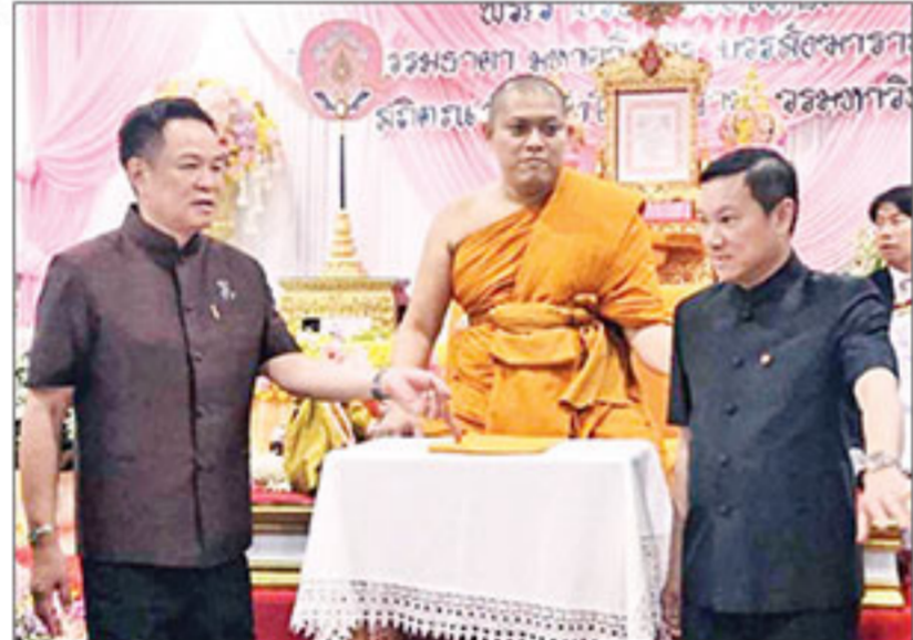
▲ กราบสักการะ : นายอนุทิน ชาญวีรกูล นายกรัฐมนตรีและรมว.มหาดไทย เข้ากราบปฏิบัติสักการะพระบรมราชานุสาวรีย์สมเด็จพระนเรศวรมหาราชที่วัดพระศรีรัตนศาสดาราม หลังได้รับพระราชทานโปรดเกล้าฯ เลื่อนสมณศักดิ์ขึ้นราช โดยนิมนต์ นายอนุทิน ชาญวีรกูล ปลัดกระทรวงมหาดไทย เข้าร่วมด้วย

เศรษฐกิจ กับ ทุเรียนลูกละร้อย ในวันที่คนทำงานถูกหัวเราะเยาะ อ่านต่อหน้า 10