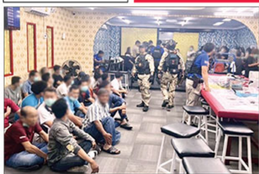
▲ ทลชบ่อน : ชุดปฏิบัติการพิเศษกรมการปกครอง เปิดปฏิบัติการสังหารปรานปรานี่กัม มุกกลาง 2 บ่อนใหญ่กลางกรุง ย่านถนนเสรีไทยและท่าอิฐราชบุรี แบบสายฟ้าแลบ โดย บิดของกลางได้กลางรายการ พร้อมจับนักพนันได้นับร้อยคน ก่อนนำตัวผู้ถูกจับมาทำ นันท์กการจับกุมที่ สน.นิมิตใหม่ และสน.บึงกุ่ม

อ้างโยงเอี่ยวคดีลอบสังหาร ‘ทวี’ ฆาตกรยังมีตัวใหญ่บงการ “ทวี” ฆาตกรคดีลอบสังหารพระพรต และขบวนการอ้างว่าจนจำ สส. มีตัวบงการใหญ่ ฝ่าลถึงท่วยความมั่งคั่ง ☛ ต่อ : ยิงสส. - หน้า 10