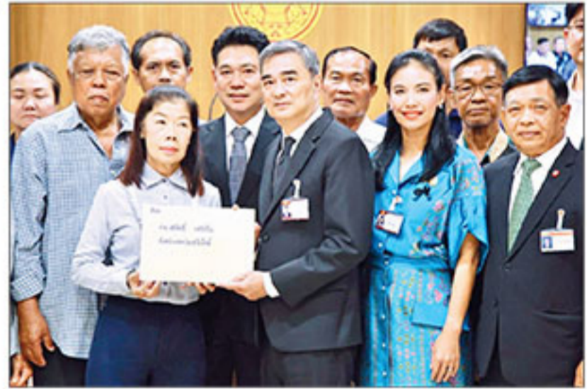
▲ รับหนังสือ : นายอภิสิทธิ์ เวชชาชีวะ หัวหน้าพรรคประชาธิปัตย์ และ สส.บัญญัติ รามชื่อ รับหนังสือจากประธานสมาพันธ์ชาวสวนปาล์มแห่งประเทศไทย ขอให้ติดตาม การทำงานของรัฐสภาในการให้ความเป็นธรรมกับชาวสวนปาล์ม ที่อาคารรัฐสภา

ประกาศพร้อมชิงลงมือ เปิดฉากซัดเรือที่ฮอร์มุซ ชูบอมบ์พันธมิตรสหรัฐ เสียงแข็งต้องเลิกปิดล้อม "ทรมปี"ประกาศขยายเวลาหยุดยิงไม่มีกำหนด จนกว่าอิหร่าน จะยื่นข้อเสนอที่เป็นเอกภาพและยอมรับมติเจรจาที่มีปากเป็น ตัวกลางรอบที่สอง ด้านอิหร่านโพสต์เตือนไม่รื้อนำลายผู้โดยสารหรือ ชี้อัดซื้อเวลาเพื่อโจมตีแบบไม่ทันตั้งตัว IRGC อิมถ้ำถูกรุกราน อีกรอบ จะทำลายศัตรูให้สิ้นซาก ➡ ต่อ : ทรมปี -หน้า 10