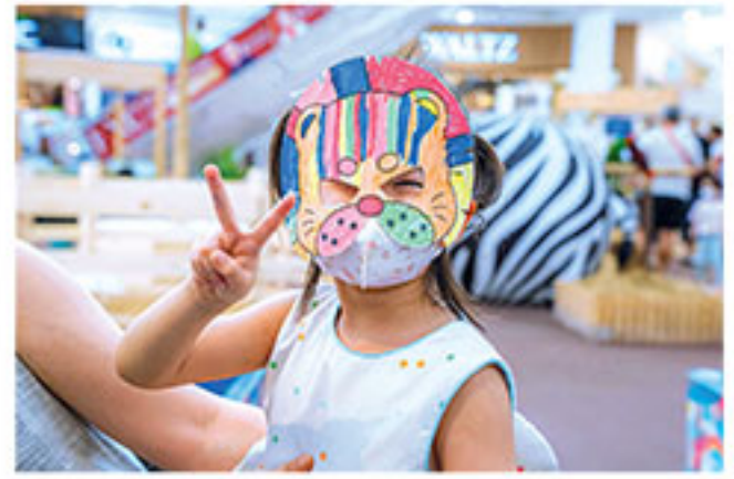
ด้วยมาสคอตสัตว์น่ารัก ที่มาสร้างสีสันและมอบรอยยิ้มให้กับทุกคนภายในงาน พร้อมถ่ายรูปได้แบบเต็มอิ่มด้วยความประทับใจไม่รู้ลืมตลอดทั้งวัน