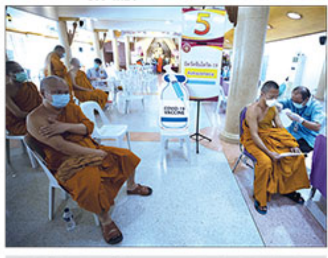
▲ ฉีดวัคซีน : เจ้าหน้าที่สาธารณสุข ออกหน่วยบริการฉีดวัคซีนโควิด-19 ให้แก่พระภิกษุ ที่วัดนาคปรก กรุงเทพฯ เพื่อป้องกันการแพร่ระบาดไวรัสโควิด-19 หลังสถานการณ์ในประเทศยังพบผู้ติดเชื้อเพิ่มขึ้นอย่างต่อเนื่อง

สถานการณ์ระบาดไวรัสโควิด-19 ในอินเดีย ยังสาหัส ยอดผู้ติดเชื้อรายวันทะลุ 1.3 แสนราย นับเป็นการติดเชื้อเกิน 1 แสนคน เป็นวันที่ 4 ในรอบสัปดาห์ ขณะที่การมอดิวัคซีน ➔ ต่อ : อินเดีย - หน้า 9